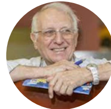
Gérard Lechêne VUES D'AFRIQUE